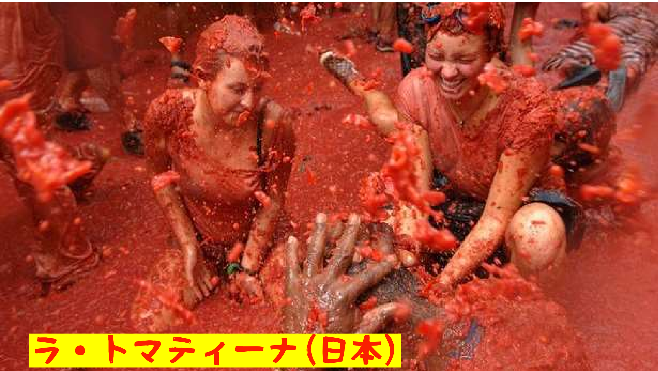
ラ・トマティーナ(日本)